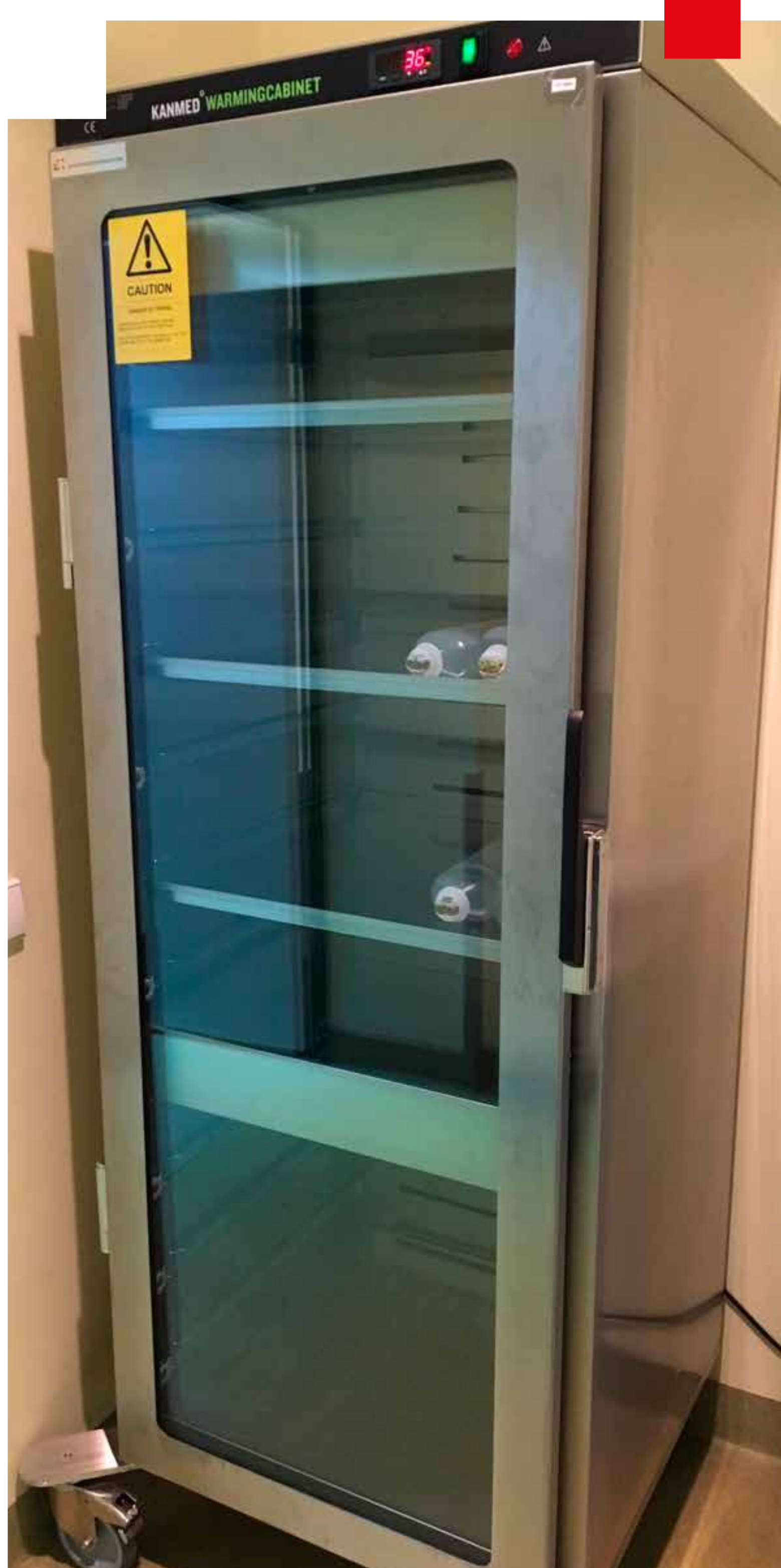
Infuzinių tirpalų šildytuvas