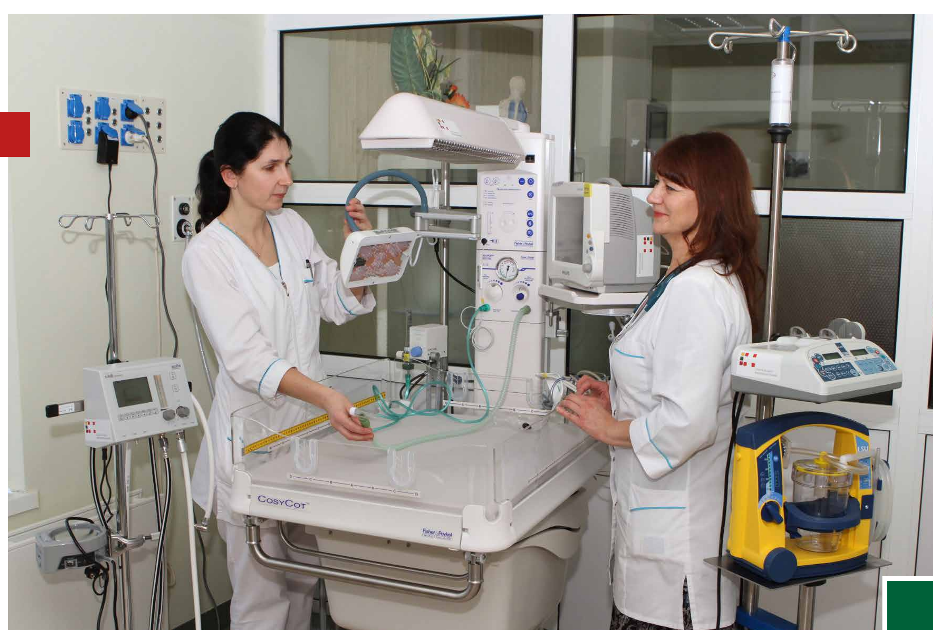
Šildomas naujagimio reanimacinis stalielis