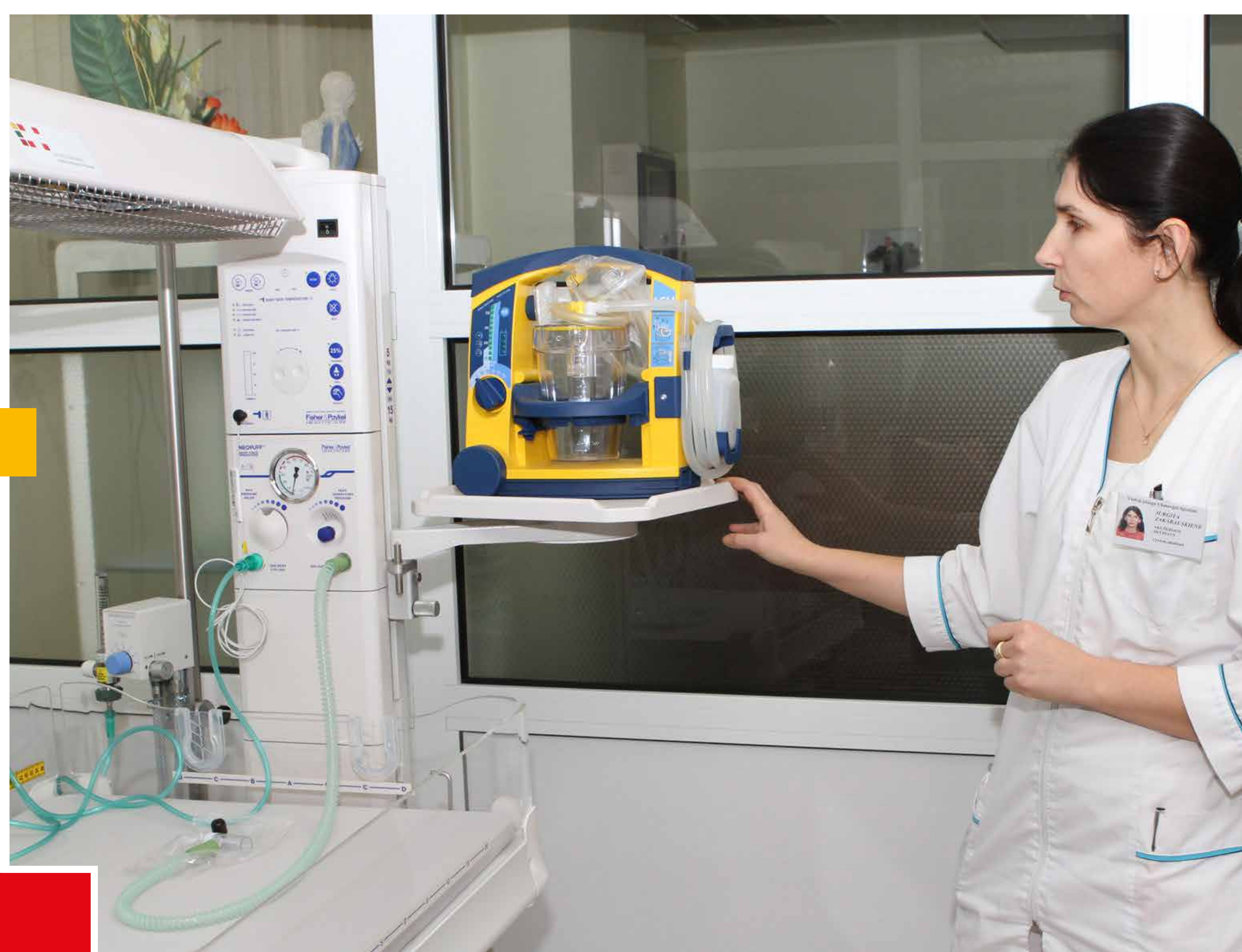
Šildomas naujagimio reanimacinis stalielis