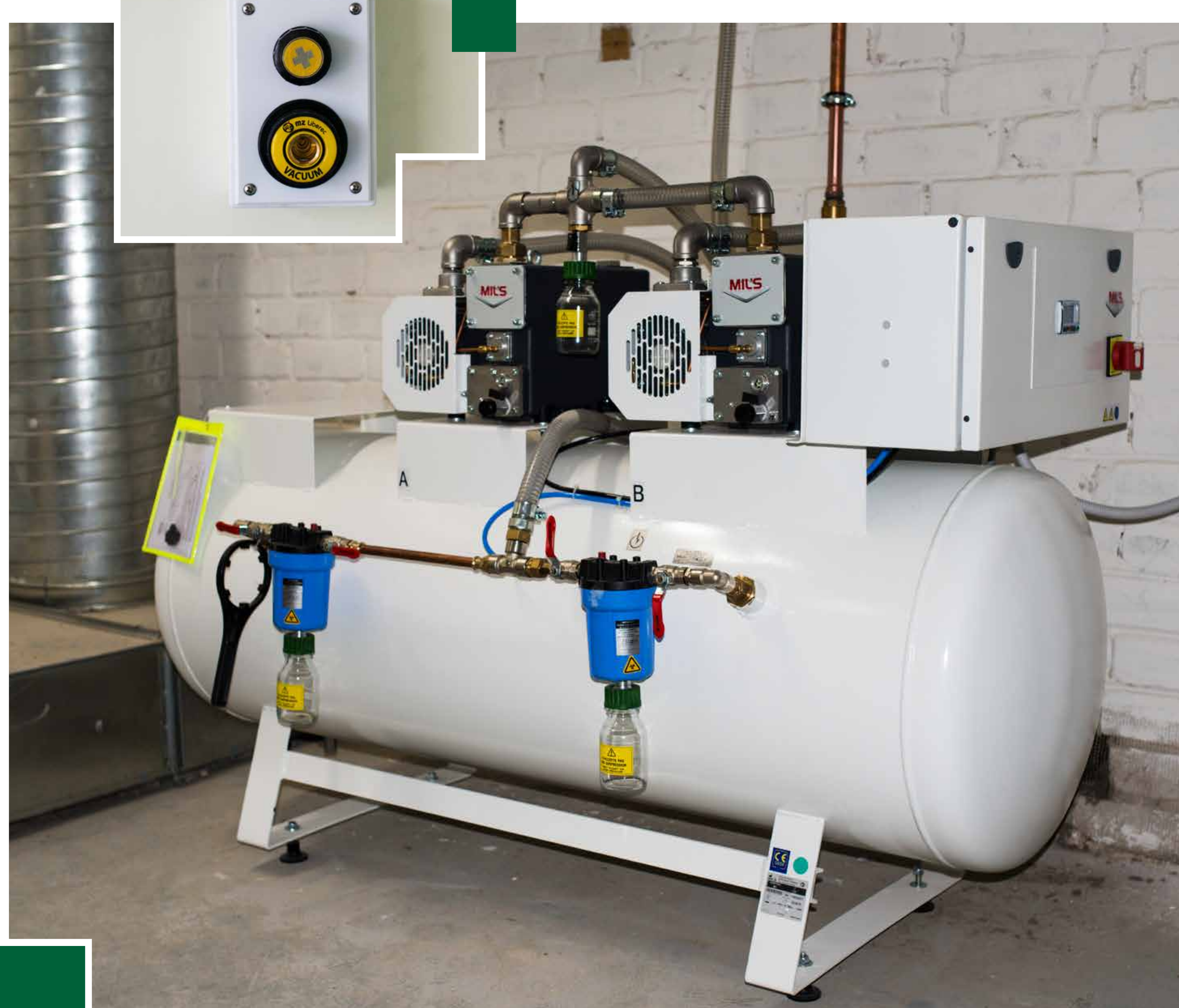
Vakuomo tiekimo sistemos įrengimas