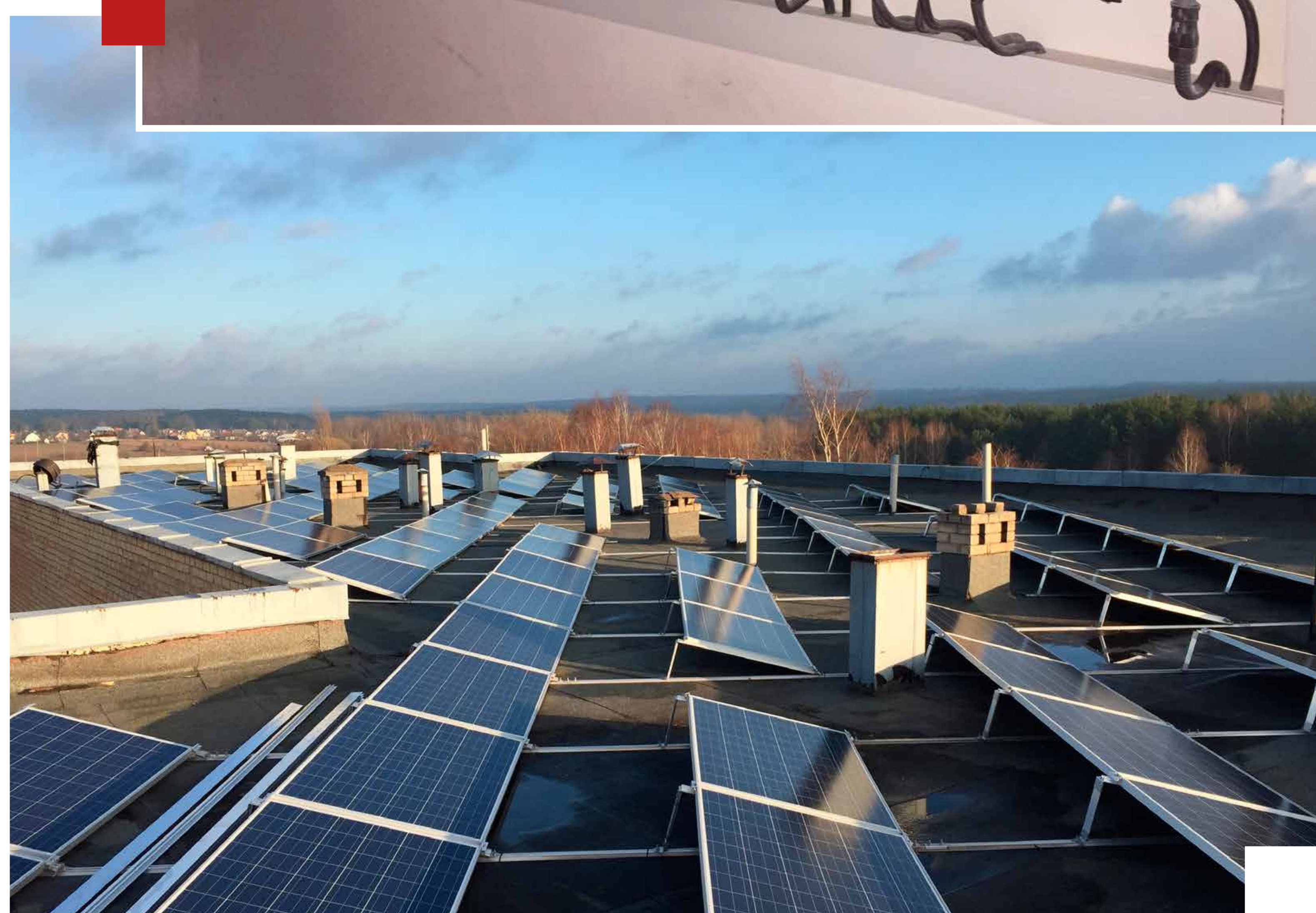
Saulės kolektoriu, šilumos siurbliu ir fotoelektrinės jėgainės sistemu įrengimas