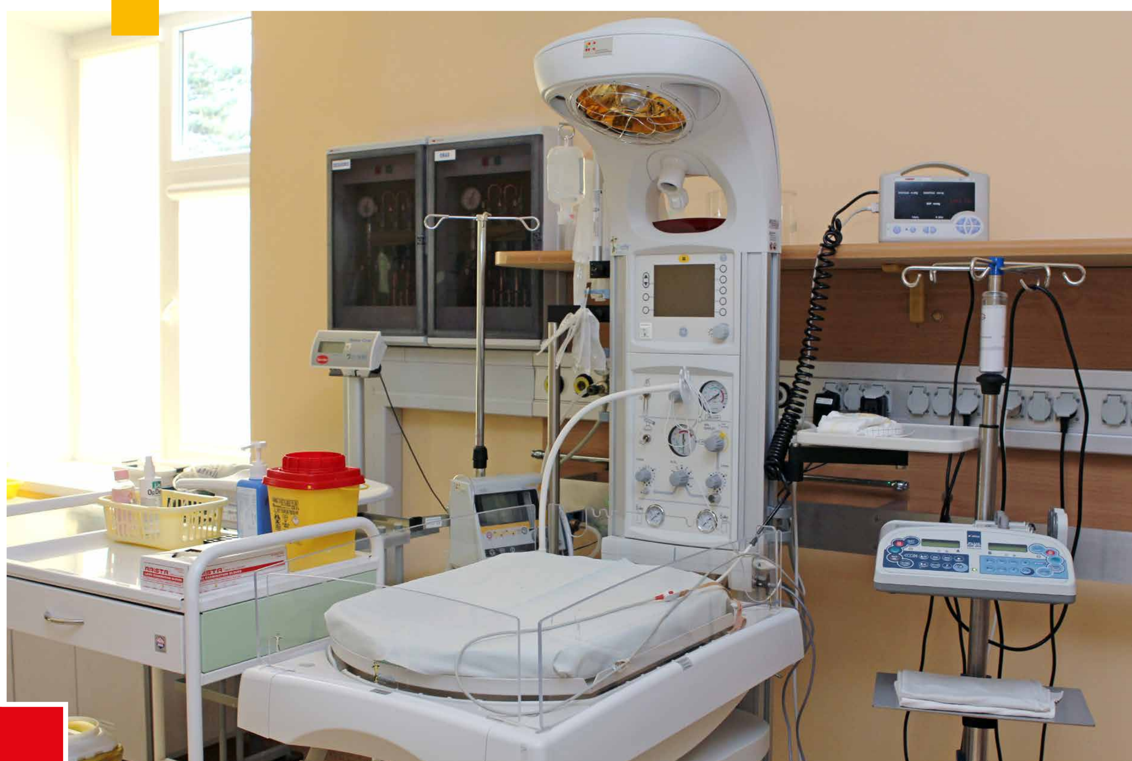
Šildomas naujagimio reanimacinis stalis ir švirkštinė infuzinė pompa

„Ypač noriu pasidžiaugti ženkliai pagerėjusiomis darbo sąlygomis. Įvykdžius renovaciją palatose ir patalpose, turime galimybę norimai keisti mikroklimatą. Pastatas reikiamai apšiltintas, įrengta kondicionavimo, rekooperacijos sistemos. Taip pat įrengta fotoelektrinės jėgainės bei saulės kolektorių sistemos. Tikime, kad šių priemonių dėka bus pasiektas ir ekonominis efektas, taupant ligoninės lėšas. Visų šių priemonių dėka atsirado galimybė užtikrinti mūsų pacientams saugių akušerinių neonatologinių paslaugų teikimą komfortiškoje aplinkoje“.