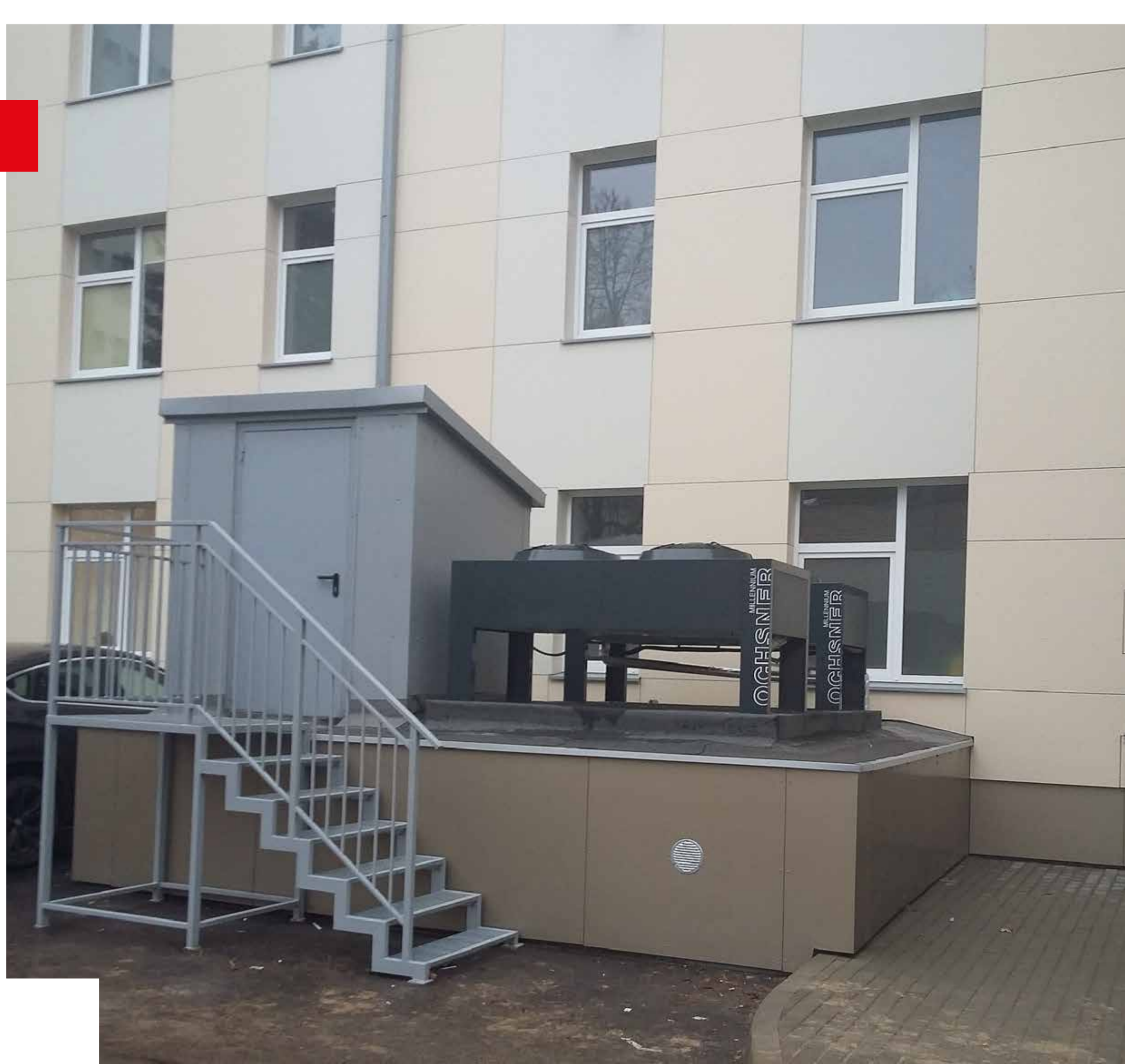
Vėdinimo sistemos modernizavimas (papildant šaldymo agregatais ir įrengiant rekuperacinę sistemą)

Lauko sienų (su cokoline dalimi) ir stogo šiltinimas (su stogo renovacija). Langų ir stiklo blokelių keitimas. Lauko ir tambūro durų keitimas.