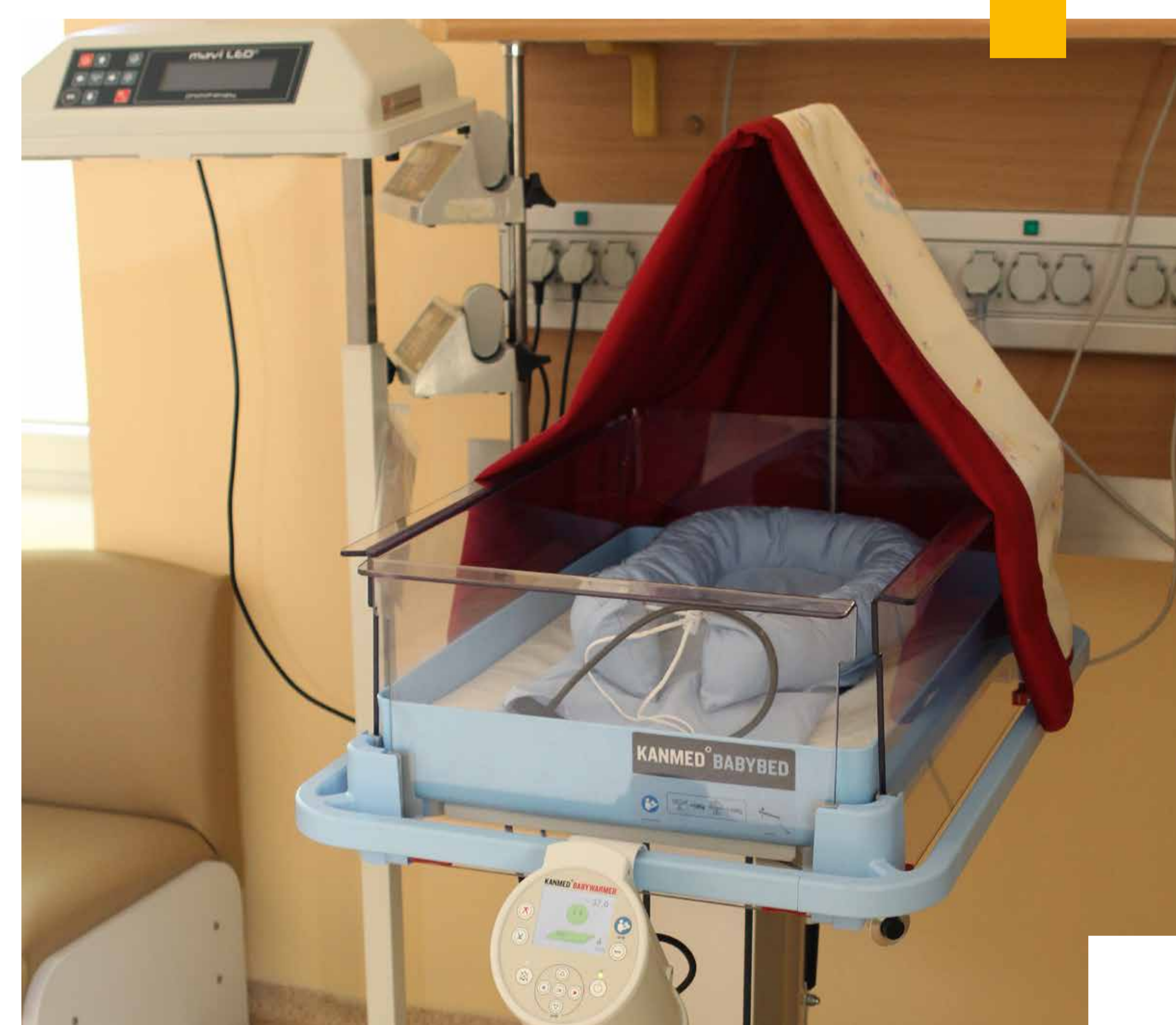
Naujagimio lovytė su šildymo įranga