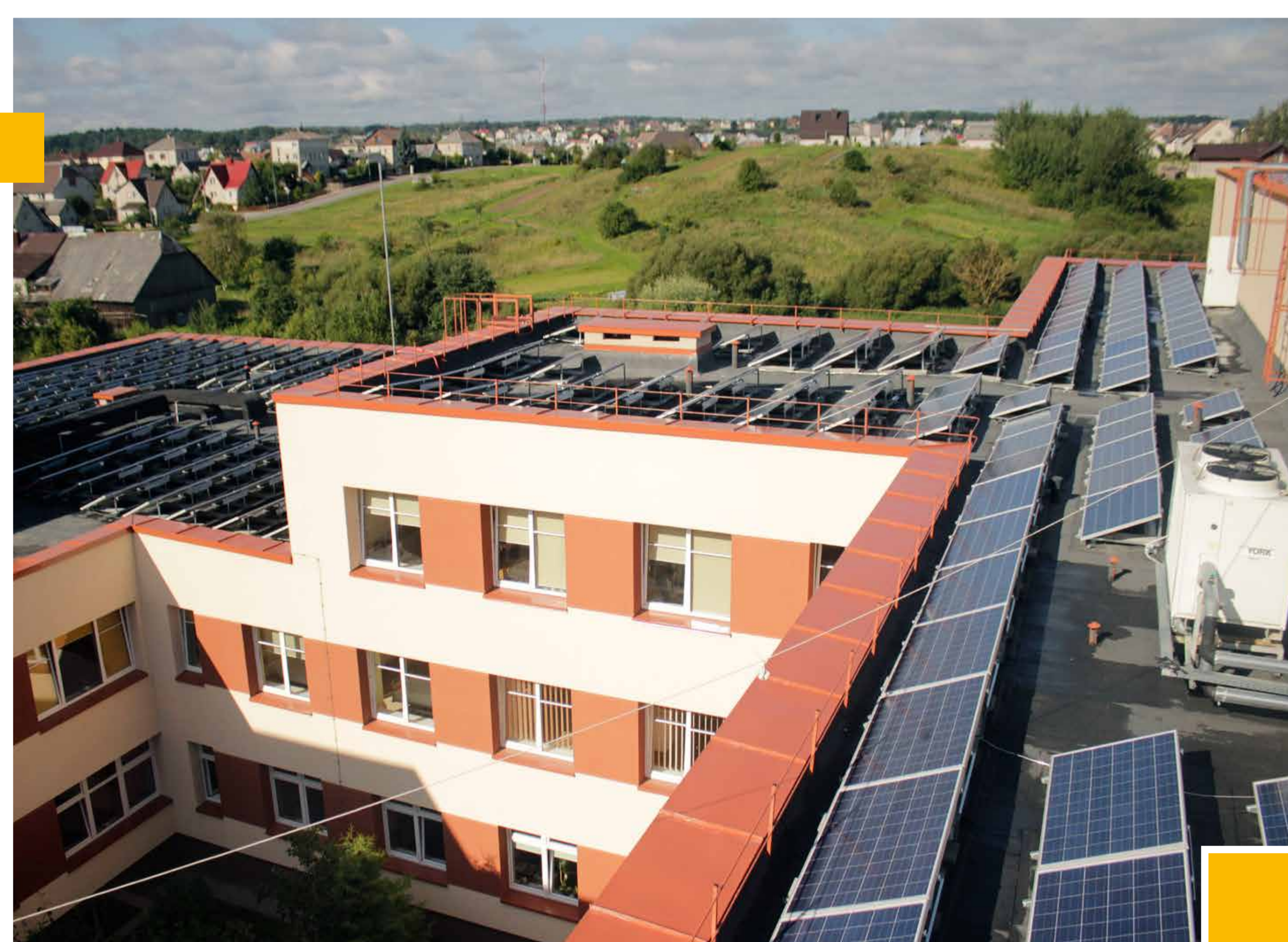
Saulės kolektorių, šilumos siurblių ir fotoelektrinės jėgainės sistemų įrengimas