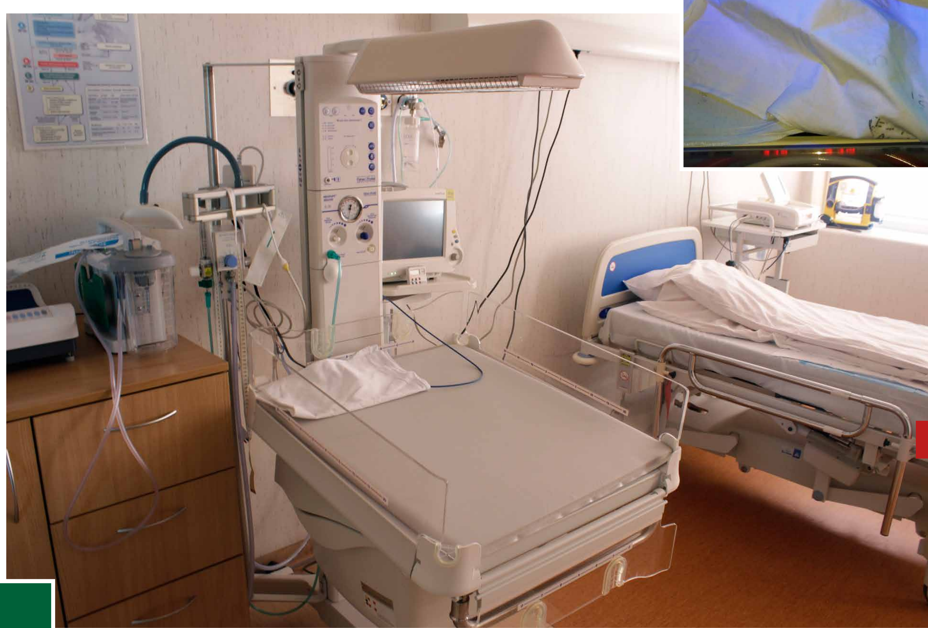
Šildomas naujagimio reanimacinis stalėlis ir funkcinė lova suaugusiam

Akušerijos ginekologijos skyriaus darbo kokybė pagerėjo, nes ne tik gavome ir naudojame naują šiuolaikinę medicinos aparatūrą, bet buvo suremontuota dalis skyriaus patalpų. Ligoninės pastatas pagražėjo iš išorės, tapo šiltesnis, ekonomiškesnis. Įrengus saulės kolektorius, šilumos siurblius bei fotovoltinę elektrinę, ligoninė turės galimybę sumažinti karšto vandens ruošimo ir elektros energijos sąnaudas.