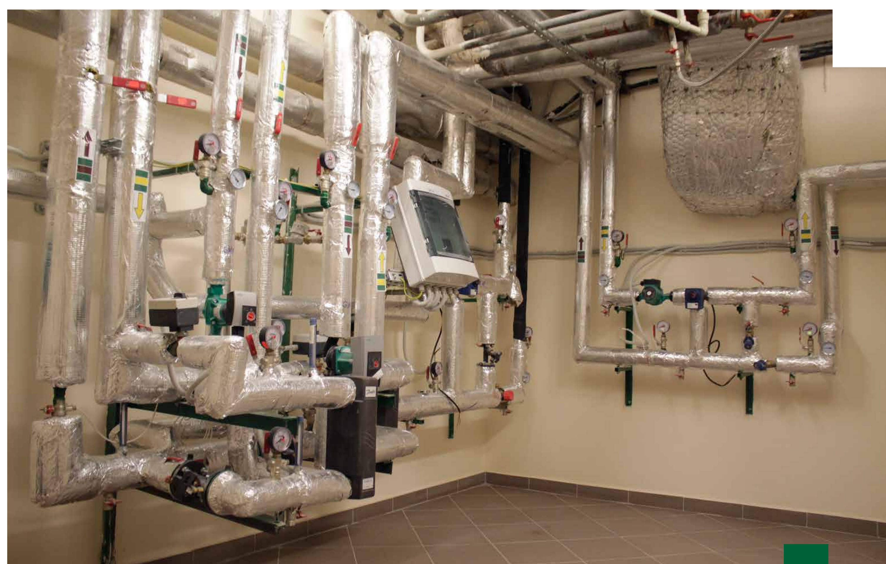
Šildymo sistemos renovacija