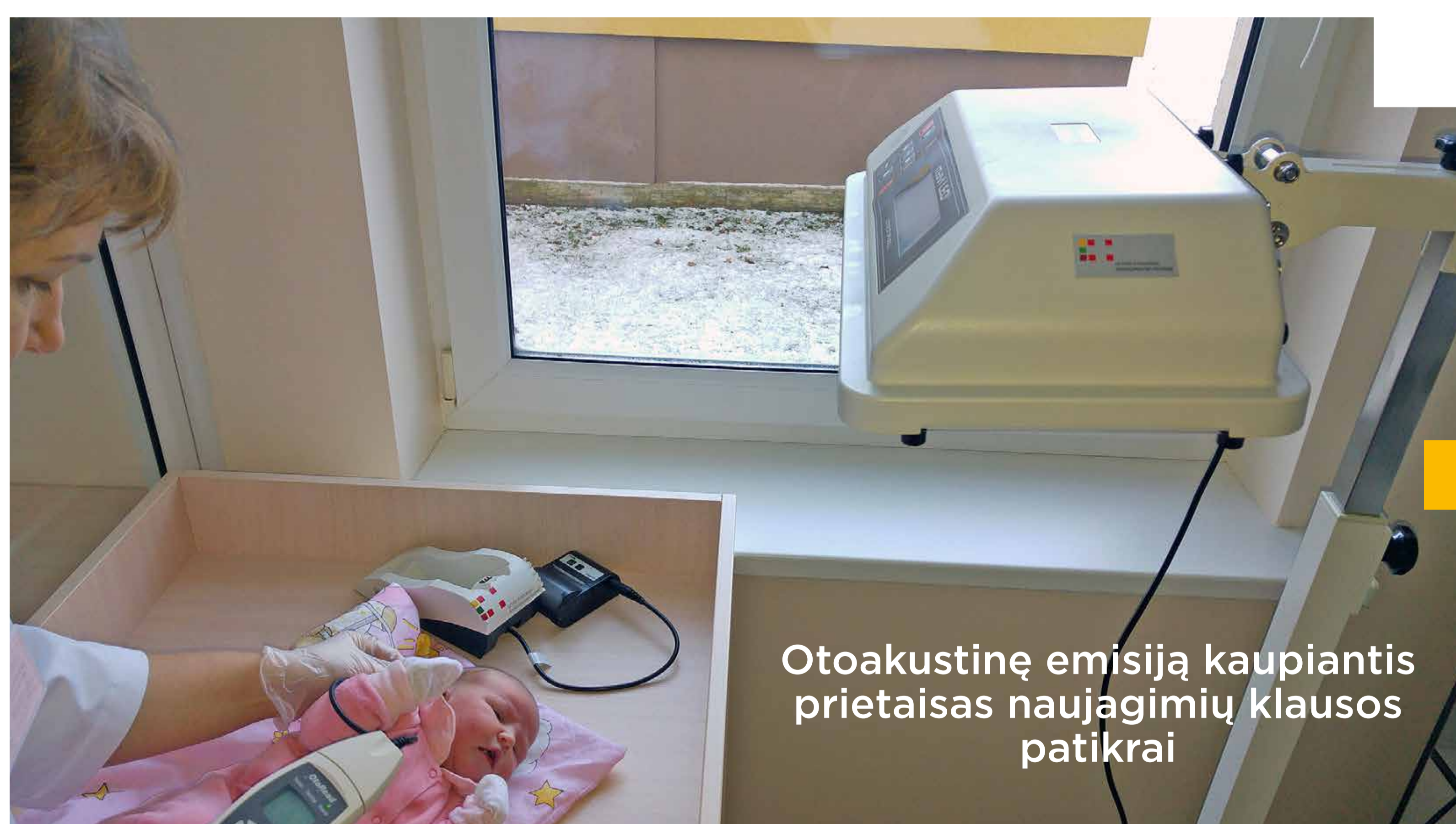
Otoakustinę emisiją kaupiantis prietaisas naujagimių klausos patikrai