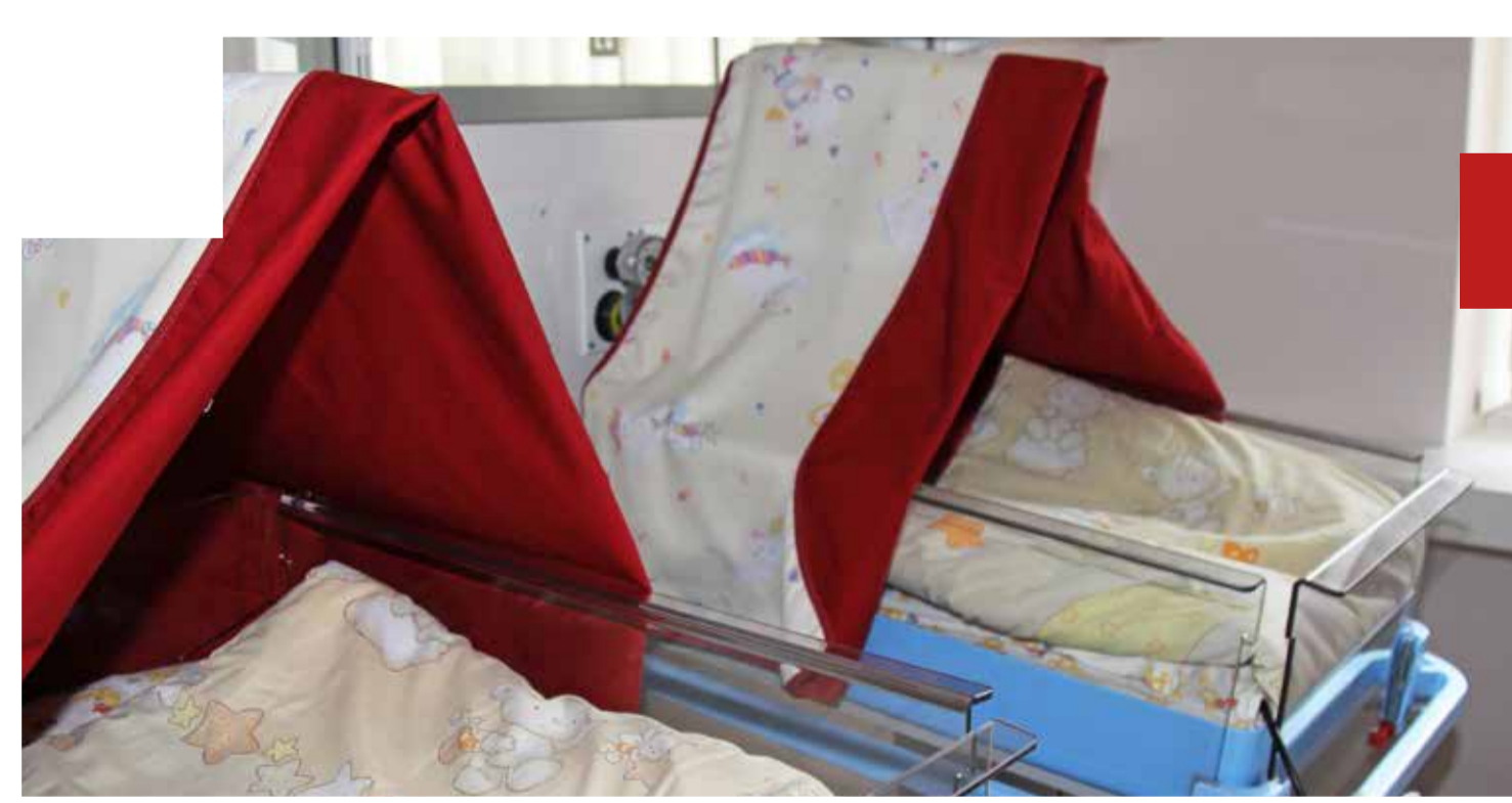
Naujagimio lovytė su šildymo įranga