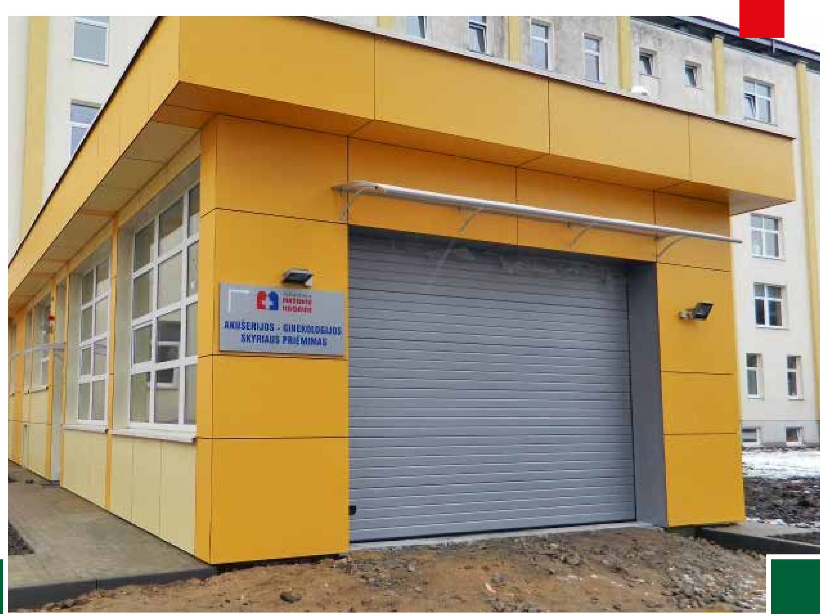
Pacienčių iškėlimo iš GMP automobilio patalpos po įrengimo