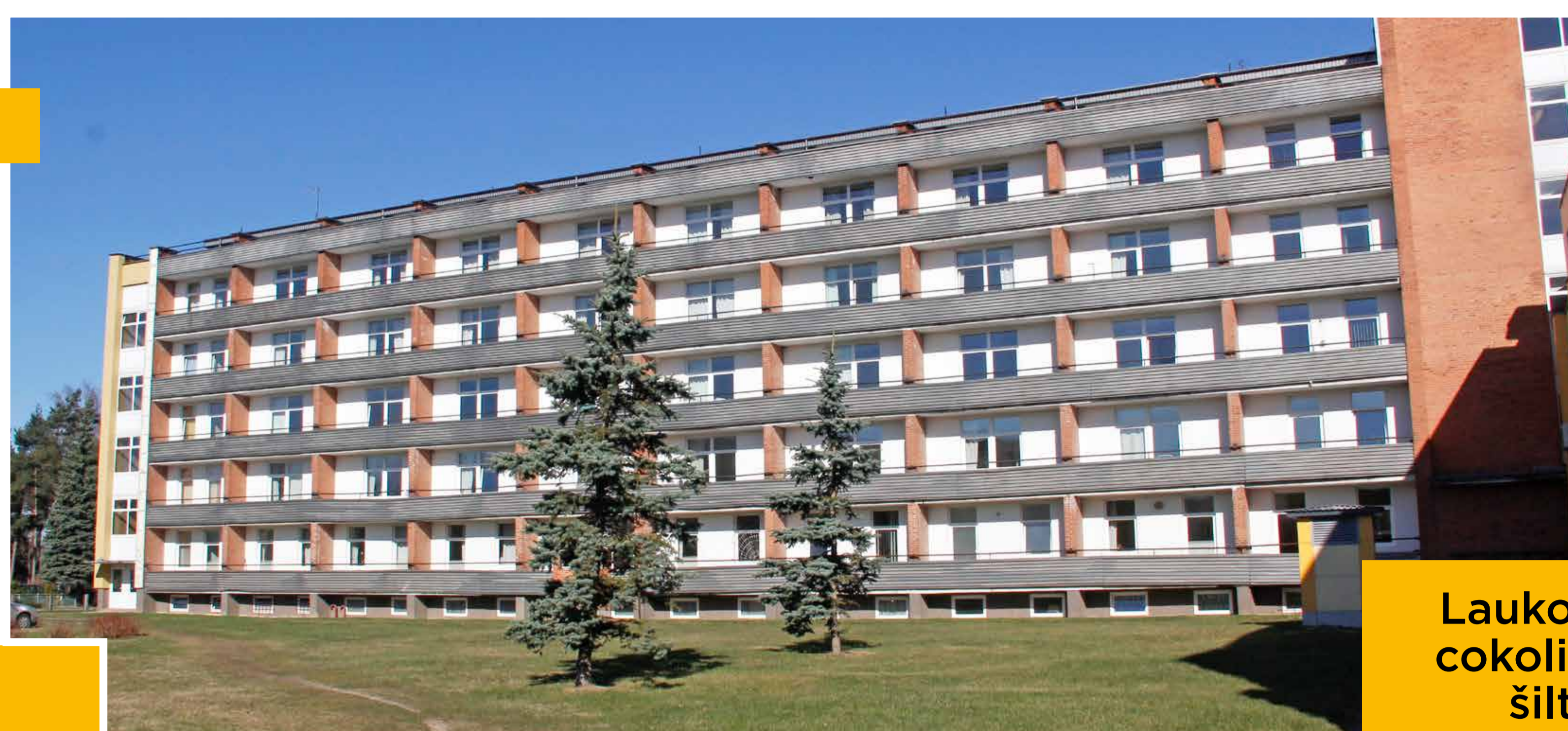
Ligoninės pastatas prieš renovaciją

– 2012–2017 m. – 1 149 372 Eur – 181 tūkst. Eur, 39 vnt. – 50