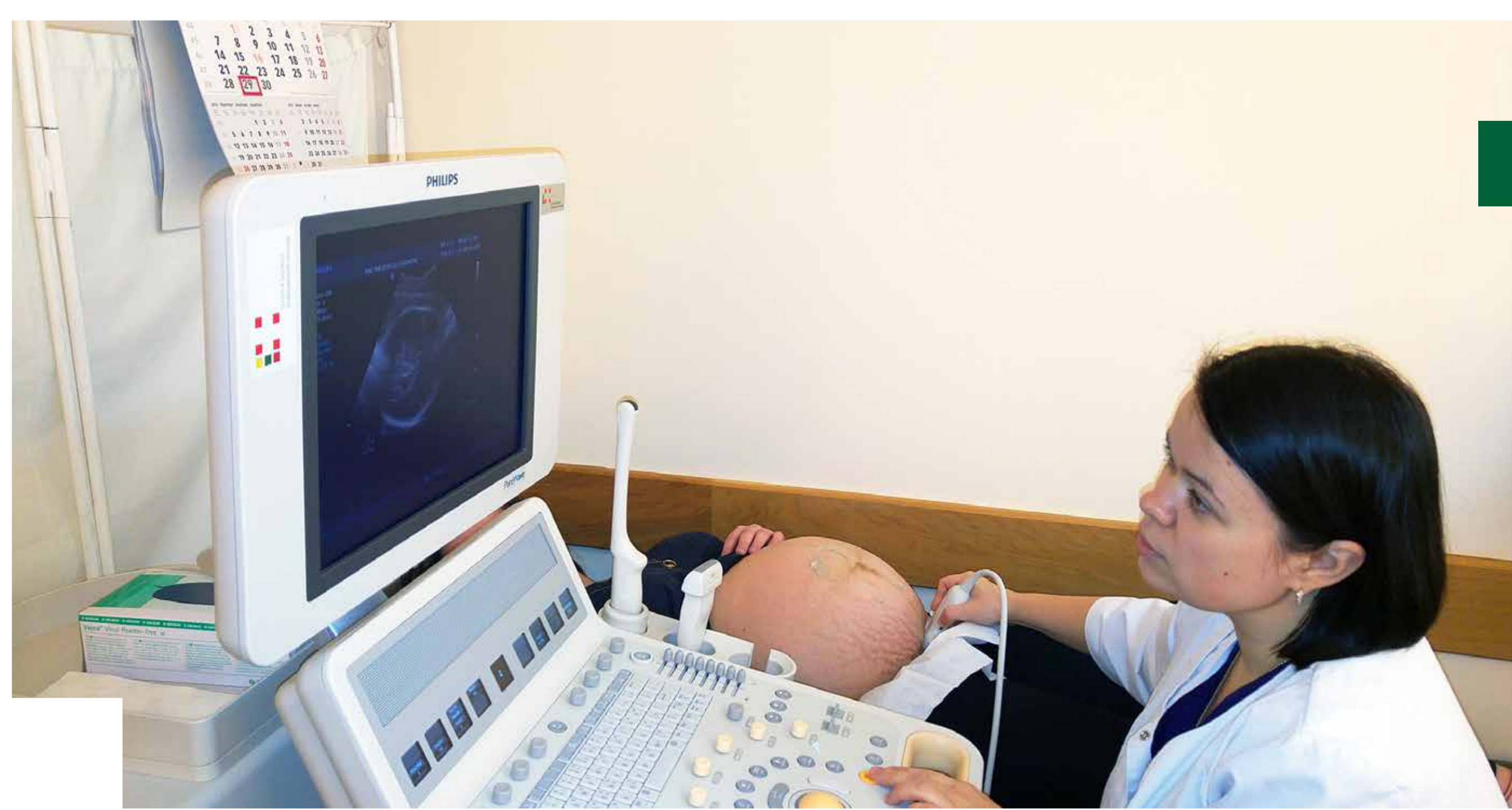
Portatyvus ultragarsinis aparatas