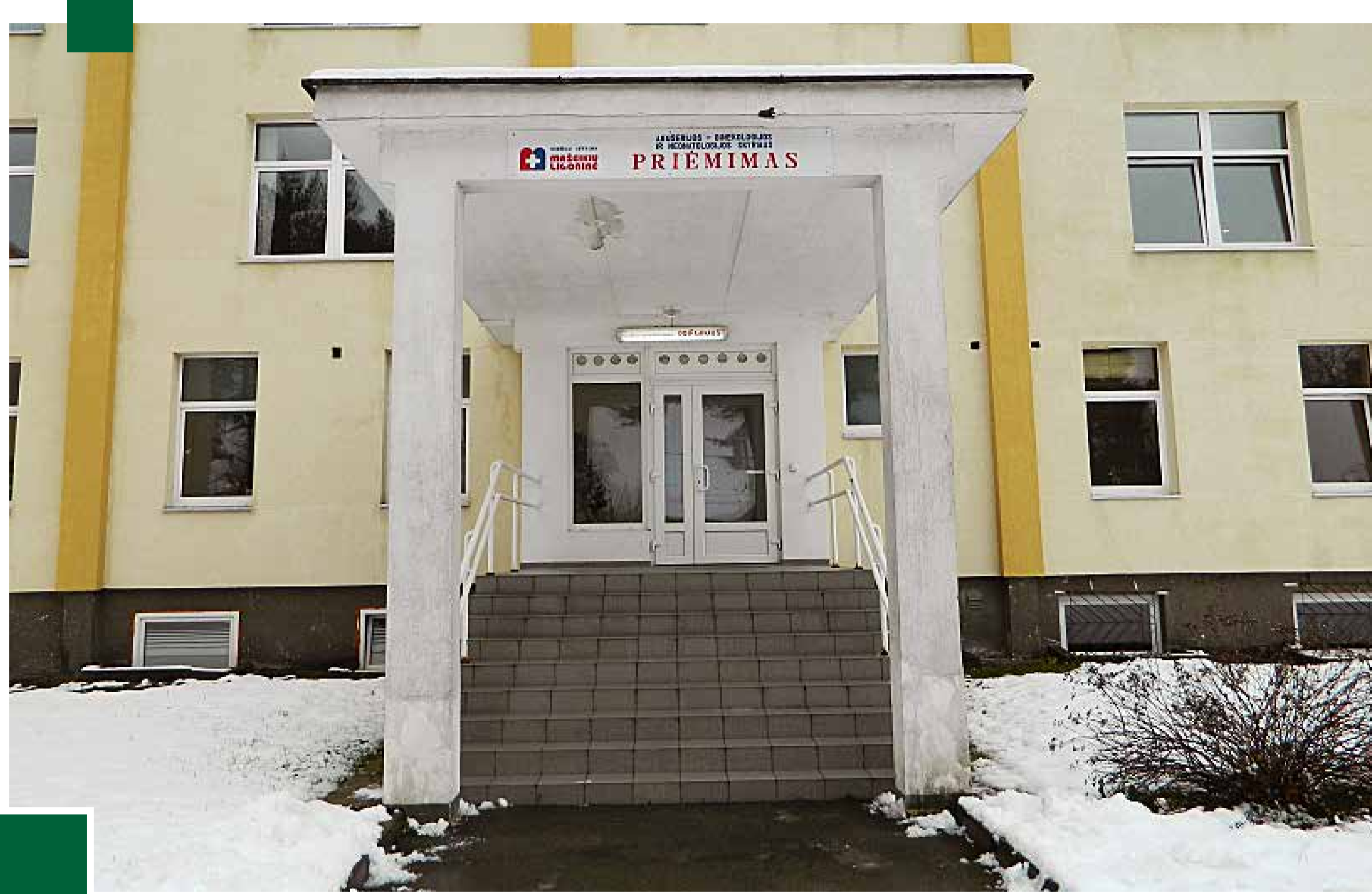
Pacienčių iškėlimo iš GMP automobilio patalpos prieš įrengimą