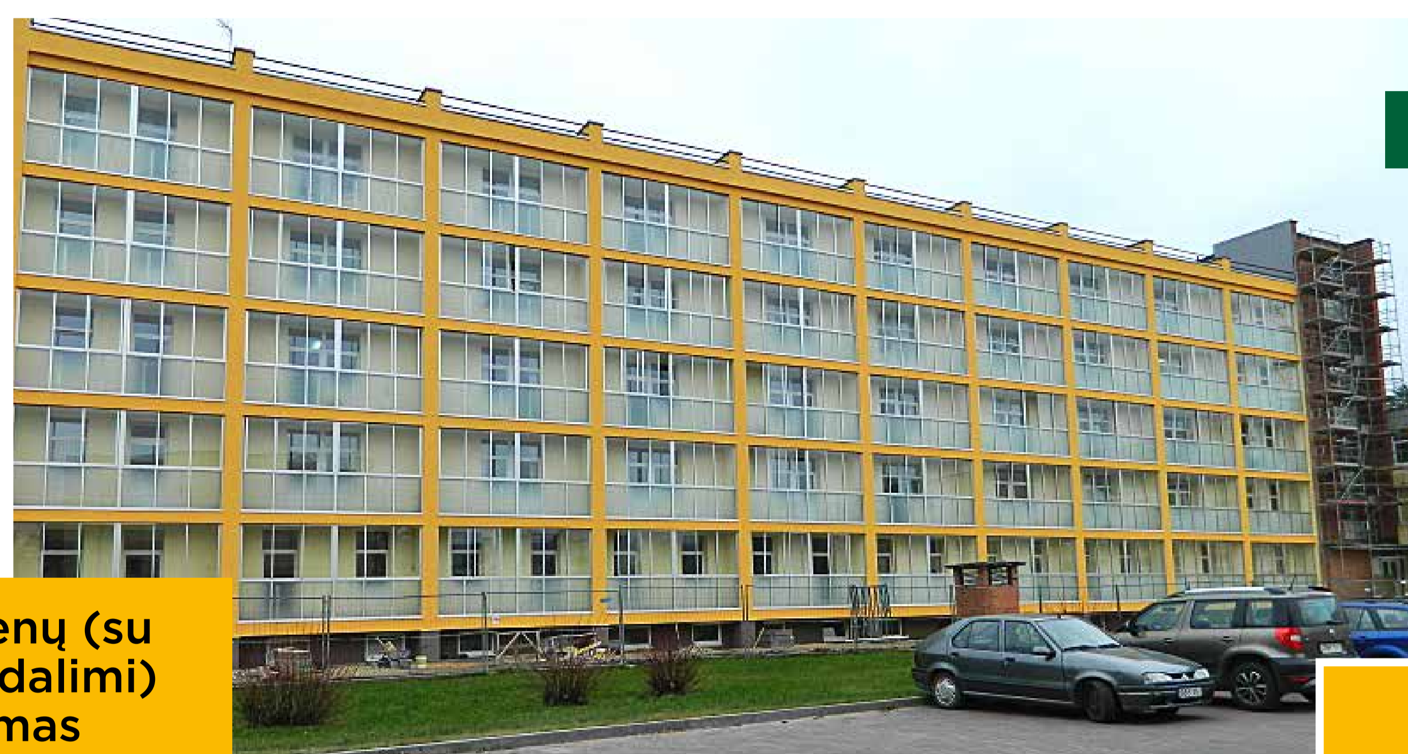
Ligoninės pastatas po renovacijos