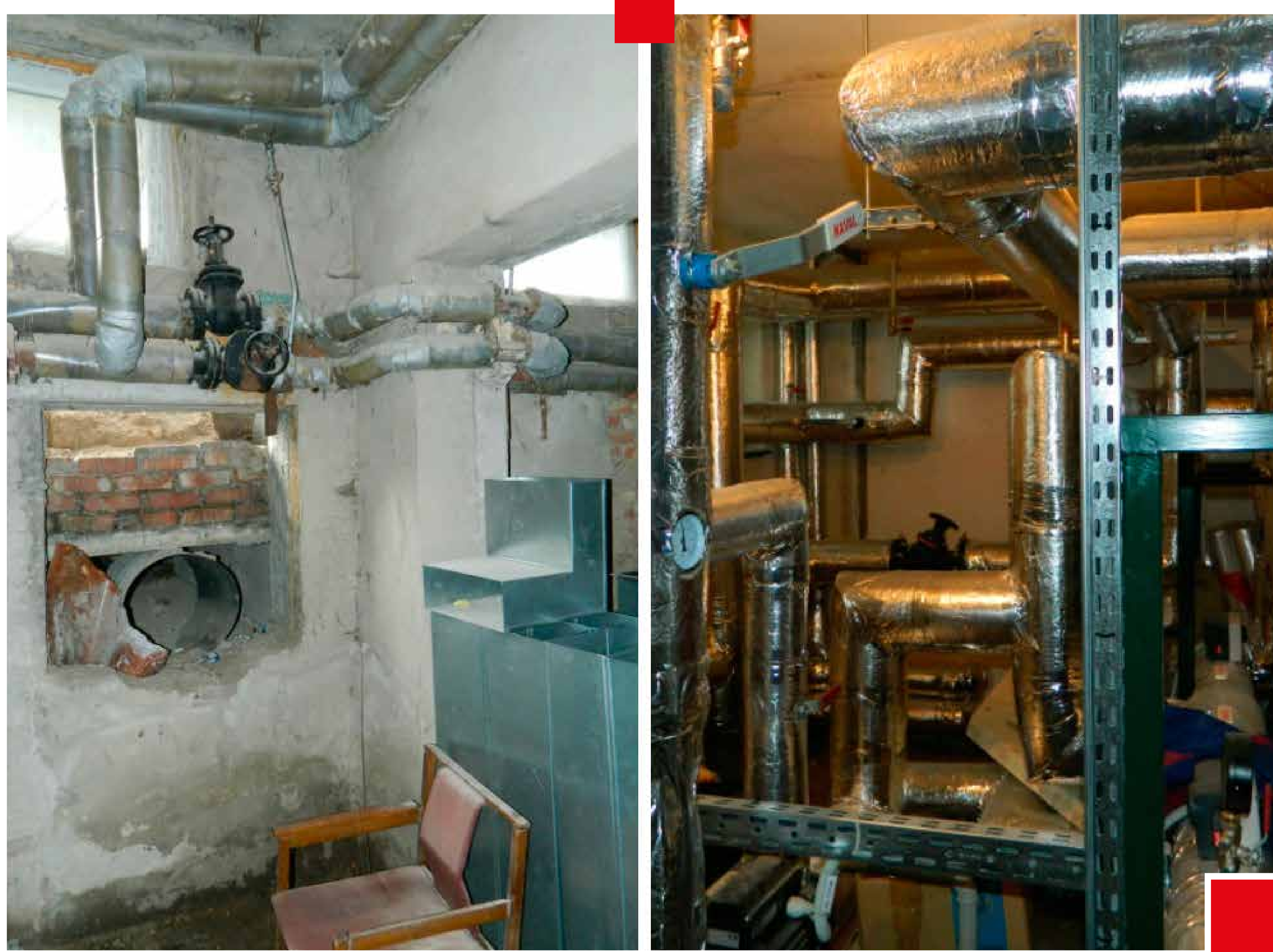
Šildymo sistemos renovacija prieš ir po