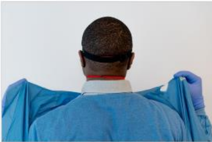
17 pav. Chalato nusirengimas: chalato nutraukimas nuo kūno