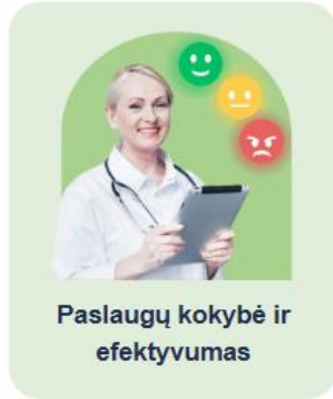
Paslaugų kokybė ir efektyvumas