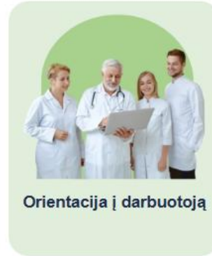
Orientacija į darbuotoją