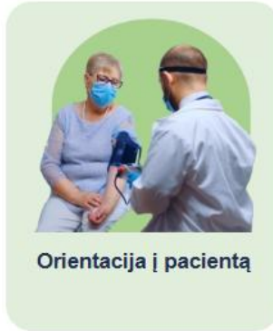
Orientacija į pacientą