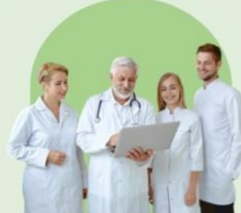
Orientacija į darbuotoją