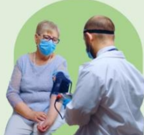
Orientacija į pacientą