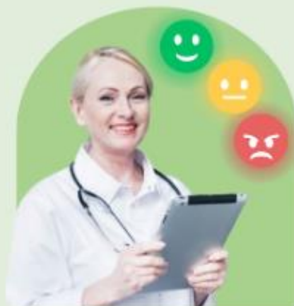
Paslaugų kokybė ir efektyvumas